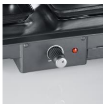
Regelbarer Thermostat und Kontrollleuchte.