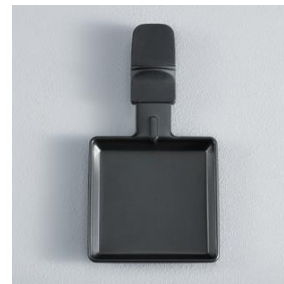
Inkl. 8 Raclette-Pfännchen mit Antihftbeschichtung.