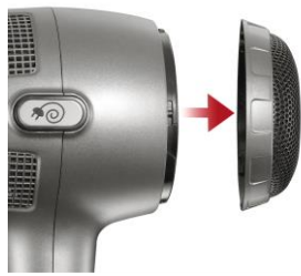
Lufteintrittsgitter zur Reinigung abnehmbar.