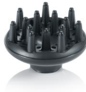
Diffusor-Aufsatz für sanftes Trocknen und maximales Volumen.