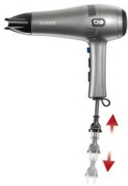
Auf Knopfdruck verschwindet das Kabel im Griff.