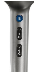
2 Leistungs- und 3 Wärmestufen. Kaltlufttaste zum Fixieren der Frisur.