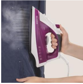
Vertikaler Dampfstoß zum Auffrischen von Textilien.