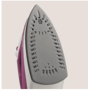
Keramikbeschichtete Bügelsohle mit Antihafteffekt.