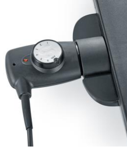
Abnehmbare Zuleitung mit einstellbarem Temperaturregler und Kontrollleuchte.