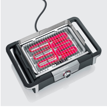
Einfaches Grillen: Temperaturen bis 320 °C