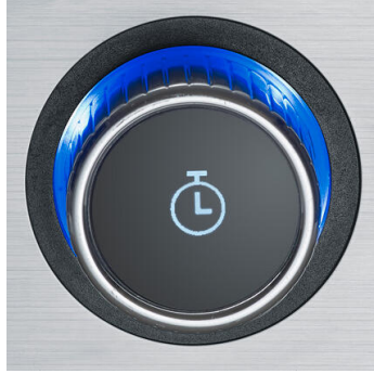
Gelinggarantie durch exakte Temperatureinstellungen im digitalen OLED Display