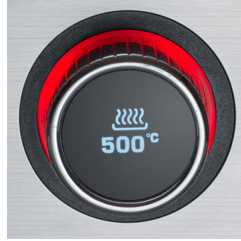
Mit integriertem Timer & Kernthermometer